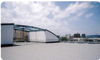
屋上(北アルプス・美ヶ原が一望)