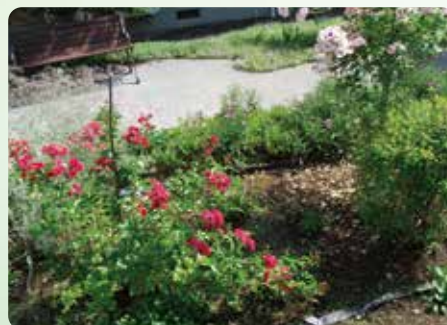
四季折々の植物が楽しめます