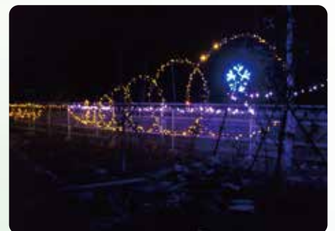
冬はイルミネーションが点灯します