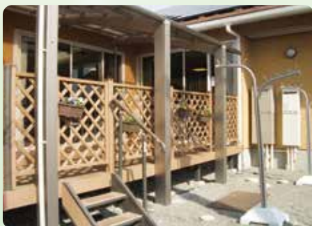
日当たりのよいウッドデッキ