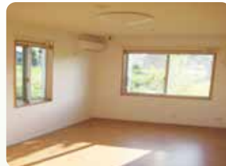
バリアフリーの広いお部屋