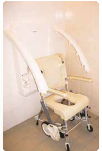
車椅子の方でも温まれるシャワー浴