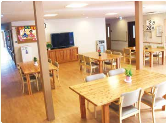
広々としたコミュニティホール

立地にも恵まれ、近隣に医療施設・銀行・ホームセンター・薬品店があり、もしもの時は主治医の細かな指示で行動できるよう非常時の連携体制をとっています。