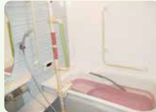
ゆったりと、楽しんで温まれるお風呂