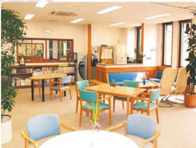
地域交流スペース“あそぼー”