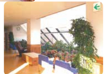
朝日の間 (2F共用スペース)