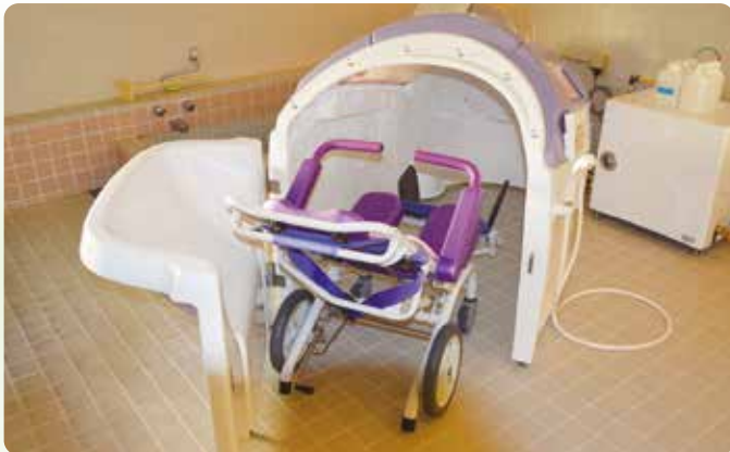
体の不自由な方対応のシャワー浴

入居様が暖かくつろげる“我が家”を目指してこの「あんじゅり」が誕生しました。 介護職員による日常の介護サポートは自立支援をふまえ優しく細やかに対応します。 建物は軽量鉄骨を採用し、バリアフリーの個室と広い廊下を提供することで非常時にも、車いす等を使用している方がスムーズに避難できるよう“平屋”となっています。 全館冷暖房（床暖房含む）を備え四季を通して快適にお過ごしいただけます。 利便性の面でも近隣に医療施設・銀行・ホームセンター・薬品店があり、もしもの時は主治医の細かな指示で行動できるよう非常時の連携体制をとっています。 あんじゅりでは職員一同で“我が家のぬくもり”をお届けします。