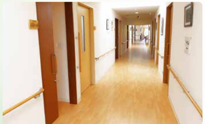
バリアフリーの広い廊下