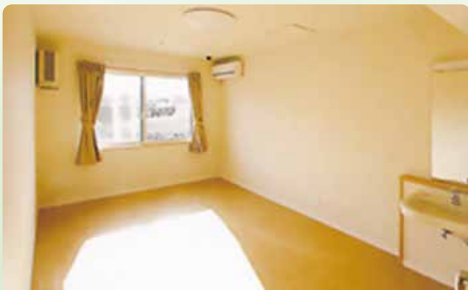
バリアフリーの明るいお部屋